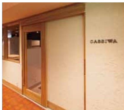
■ エントランス ネームプレートにもエージング加工を施しています