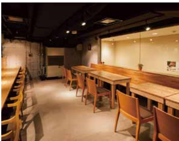
■ ベンチ&テーブル席 窓際の長いベンチにも白木の集成材を使いナチュラル感をアピール