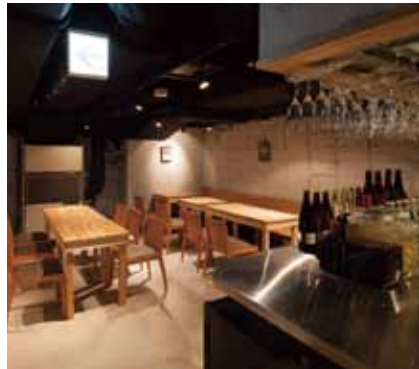
■ キッチンからホール キッチンからもホールに目を配れるよう視界を確保