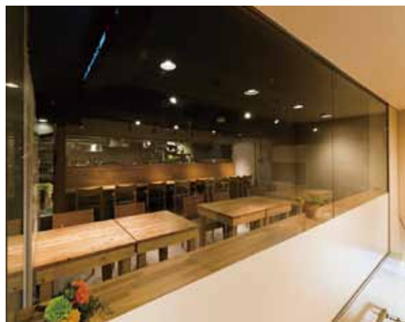
■ 外観 キッチンやホールの活気が伝わるように窓を大きくレイアウト