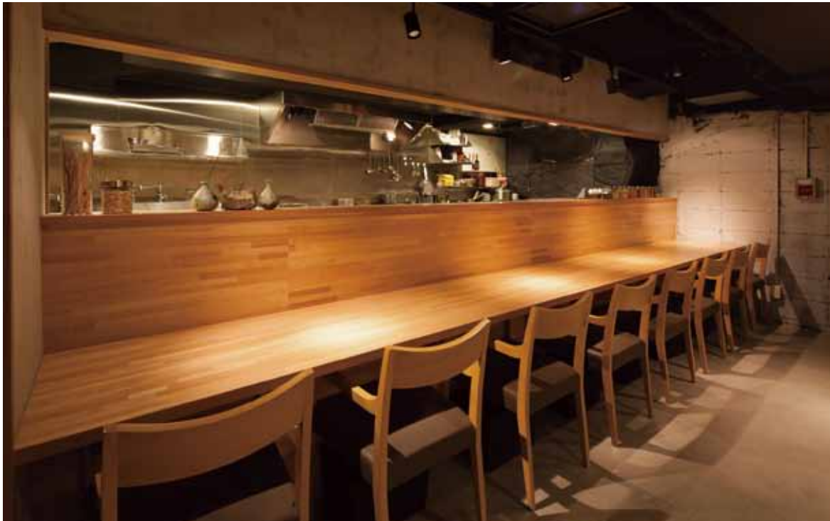
■ カウンター席 白木の集成材を使った奥行きのあるカウンター。前には同素材の立ち上がりを設け、キッチンの活気は伝えながらも食事に集中できるよう配慮