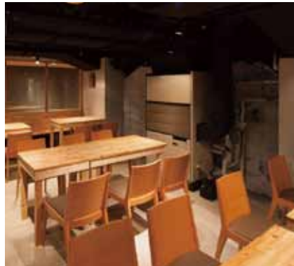
■ テーブル席 ゆったりと食事を楽しんで頂く大きいテーブルを配置