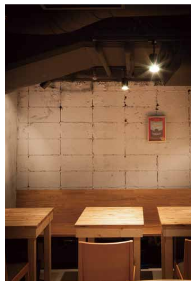
■ 内壁 コンクリートブロックを積み上げた内壁面はラフに塗り上げてナチュラル感を演出