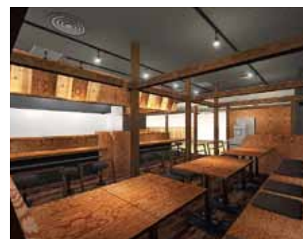
■テーブル席のお客様から見た店内パース