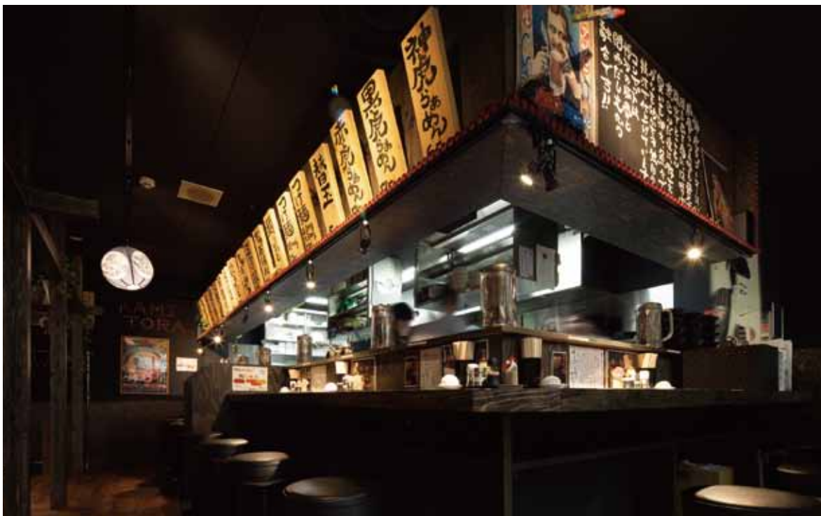
■ホールからカウンター席 キッチンにそってU字型に組まれたカウンター。ラーメン店のウリは一人客への即応性ゆえ、キッチンとカウンターが近いほど効率がよい