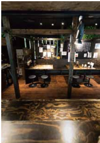
■厨房からテーブル席 厨房から店内全席が見渡せるようにレイアウト