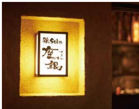
■ サイン 上質感のある外壁の質感を際立たせる和の風情あふれるサイン