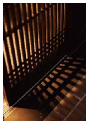
■ 格子が生み出す影が心地よい