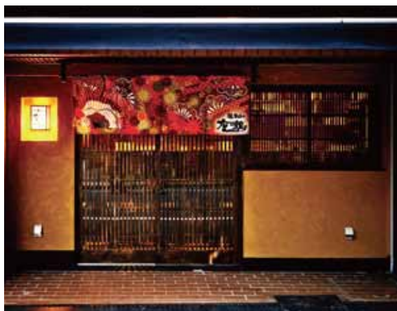
■ エントランス 上質感を漂わせる佇まいはコンセプト通り、まさに京都の割烹を思わせる