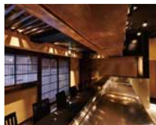
■ 使い勝手を考え、キッチンから隅々まで目が届くようにレイアウト