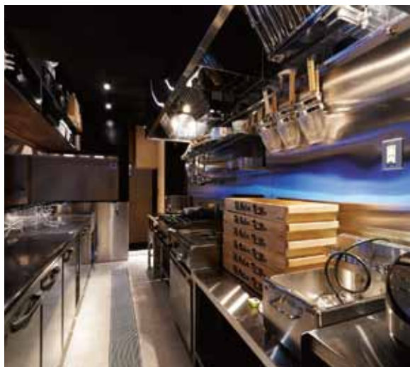
■ 動線を充分にとった働きやすいキッチンスペース