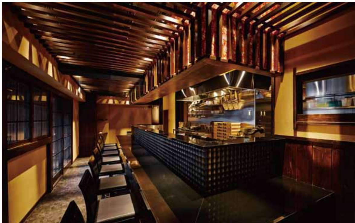
■カウンター席 鏡面仕上げのカウンターに、タイル貼りの立ち上がり、そして陰影を演出する格子で雅やかな情緒を表現