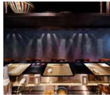
■厨房からカウンター キッチンから素早く配膳しやすいレイアウト