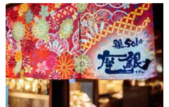
■人目を惹くカラフルな暖簾が賑わい感を演出