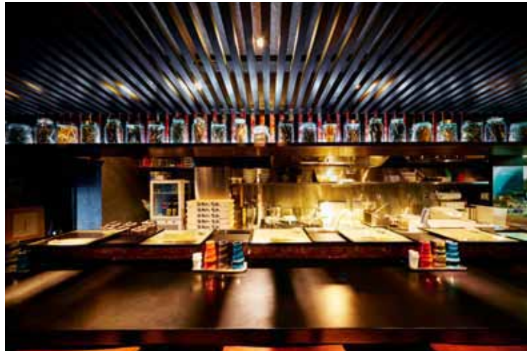
■カウンター席 カウンター席とキッチンとの仕切りを低くして、お客さんへの目配りが効くように配慮