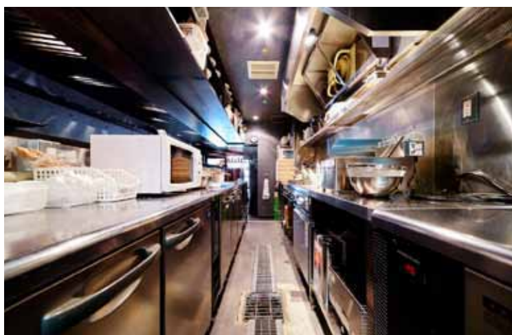
■盛りつけがしやすいワークスペースも充分に取られているのがポイント