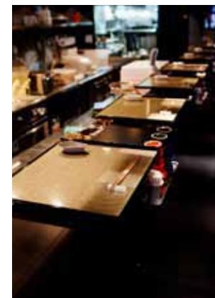
■カウンターの塗装はシックな素材感のメラミン樹脂仕上げ