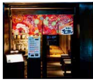
■エントランス 陰影のある照明が謎めいた雰囲気を出す