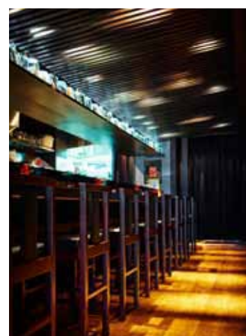
■カウンター背後のスペースも充分に取る事でお客様がゆったり味わえるよう配慮