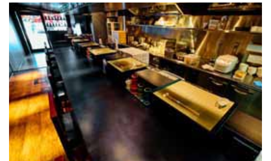
■ゆったりラーメンが味わえるようカウンターは奥行きを深めに