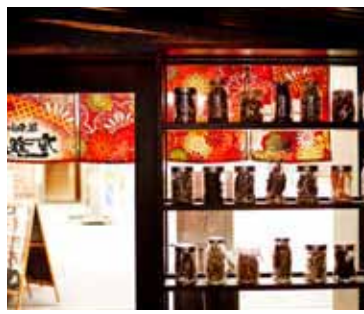
■ホールからエントランス シェルフからも日差しが差し込むデザインに