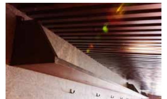
■荷物置きは視線を邪魔しないように高めに設置