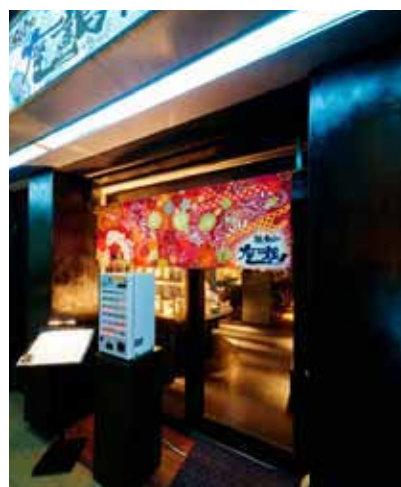
■エントランスに券売機を設置