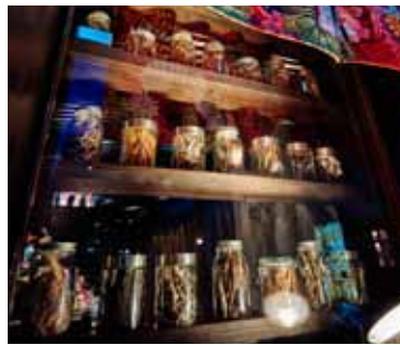
■出汁シェルフ 出汁を取るための素材がズラリと並べられる