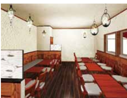
■ ファミリーにも対応しやすい禁煙席側