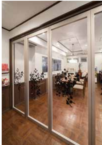
■ 喫煙席と禁煙席を区切るアコーディオンドア 喫煙席から煙草の香りが漏れないよう仕切っている