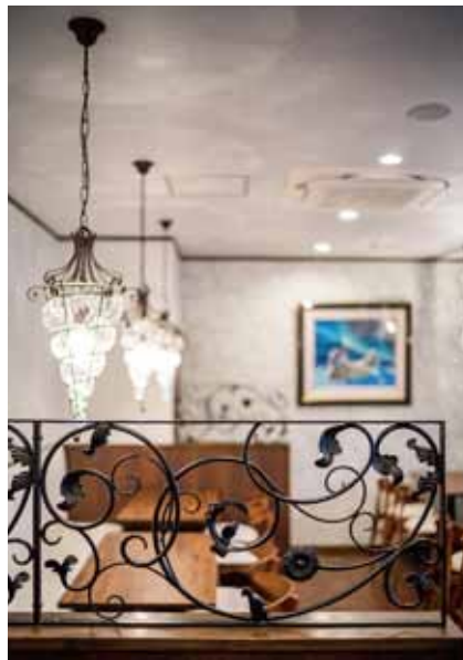
■ アイアンワークス ブロンズ像に合わせた植物文様のアイアンワーク