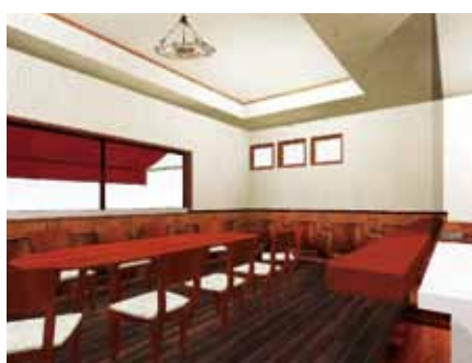
■ 個人客が多いことを想定した喫煙席側