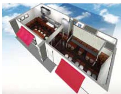
■ 図面からは想像できない全体像を提示