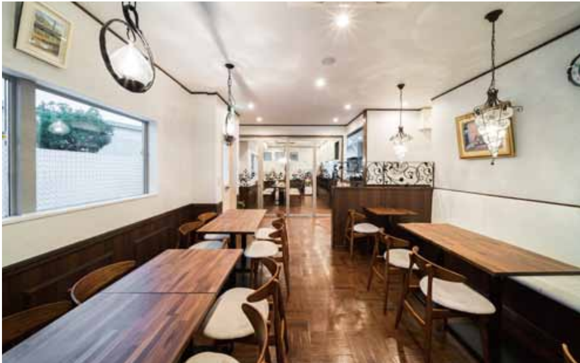
■ 禁煙席より喫煙席を臨む 手前は女性のグループ客やファミリーを想定した禁煙席。テーブルレイアウトが素早く変更できるようにデザインしている