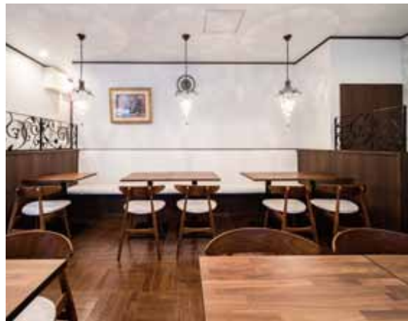
■ 禁煙席 ヨーロッパなアンティーク調のペンダントライトが光の優しさを演出