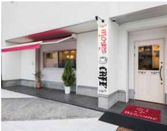
■ 外観 白壁に真っ赤なオーニングとレトロな店名ロゴが映える