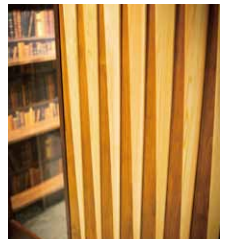
■ エントランスは組木細工で軽やかなリズムを表現