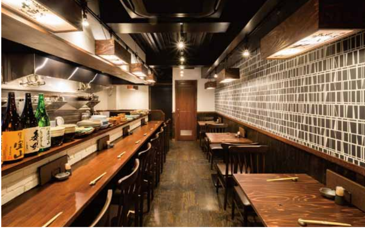
■ カウンター 厨房からホールへの出入りをカウンターの左右両サイドに設けているから、お客様からのオーダーに応じてスムーズに対応できる