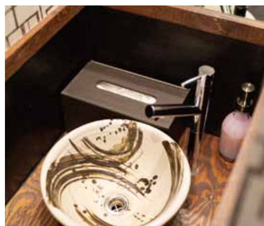
■ 壁紙とトーンをシックに合わせたトイレの手水鉢