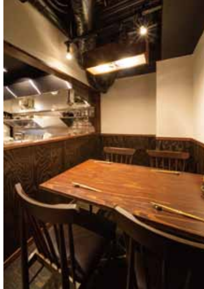
■ 4人掛けテーブル席 仕切りを低めにお客様の要望を見逃さないよう配慮