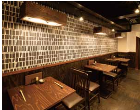
■ ペアテーブル ペアテーブルのバックには軽快なリズムをイメージさせる壁紙を