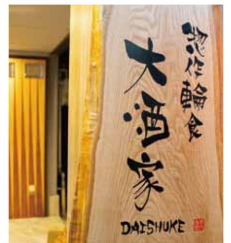
■ 一枚板にダイナミックな筆文字のロゴが踊る