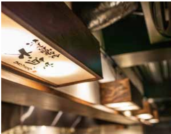
■ 客席上部 上部から光を投げかけるダウンライトにはロゴを配する遊び心が