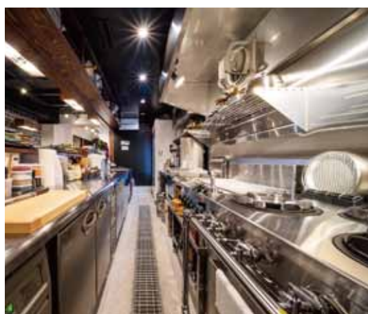
■ キッチン通路は60~70cmと素早く動ける導線を確保