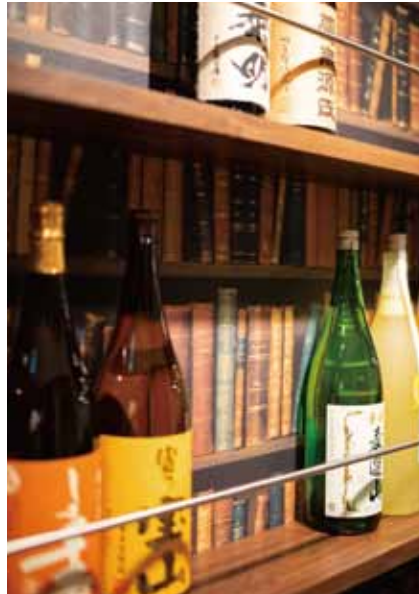
■ ボトルキープスペース ボトルを取るとアンティークな本棚が現れる仕掛けに