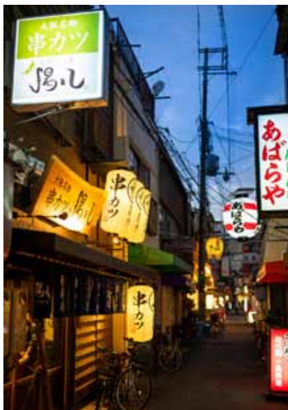
■ 界隈性を生かしたエクステリア 提灯を使ったサインで景観を生かしながらアピール