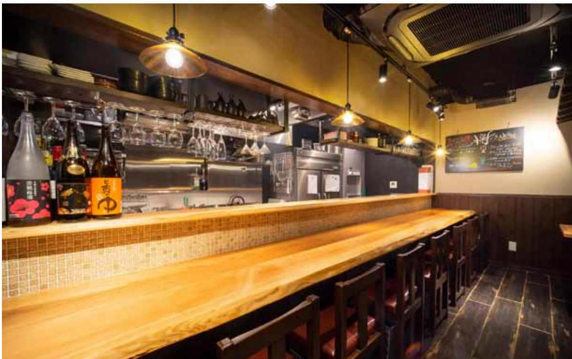
■ カウンター 1階はカウンターと4人がけのボックス席を設けています。ワインのラインナップが魅力ゆえ、カウンター上部にはバル仕様のグラスホルダーを設置