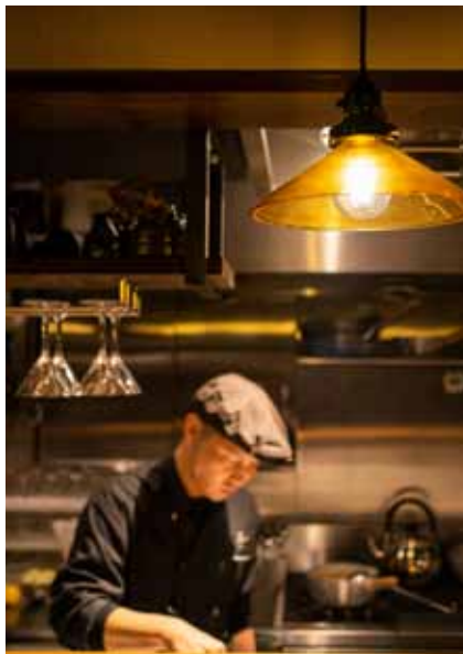
■ ペンダントライト 陰影のある柔らかな光に、お客様のお酒が進みます