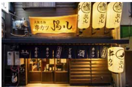
■ 提灯ならではの柔らかな光が路地へとお客様を誘います