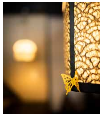
■ 揚羽蝶モチーフを使ったレトロなペンダントライト