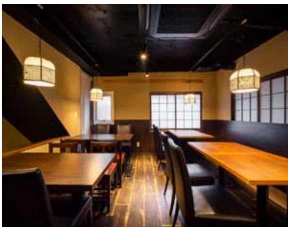
■ 2階客席 大人数でのパーティにもうってつけの設え。20名が着席可能です