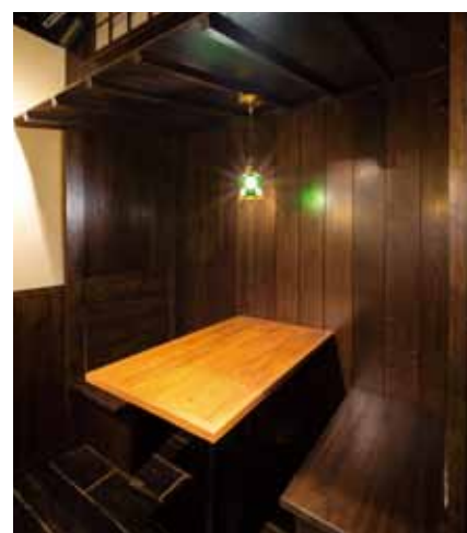
■ 1階奥に配置されたボックス席