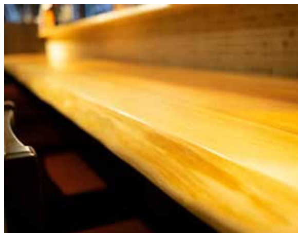
■ カウンター材 木目が美しく使い込むほどに味が出る杉の無垢板を使用