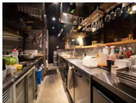
■ スムースに作業が進むよう調理器具を効率的に配置