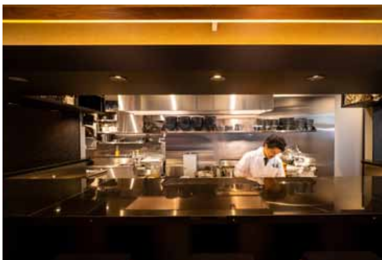
■ 「座銀」カウンター 黒御影石を贅沢に使った高級感のあるカウンター。奥行きがありラーメンをゆったり味わえる