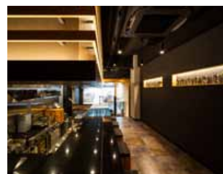
■ 「座銀」らしいモダンでシャープなインテリアに