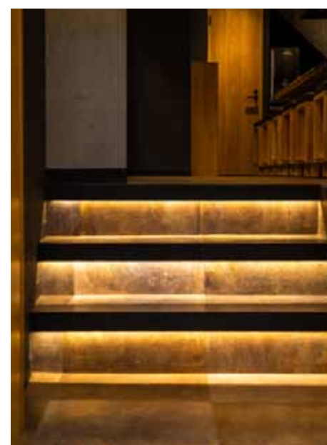
■ 間接照明で照らし出されるエントランスのステップ