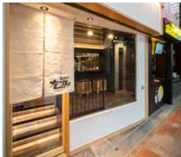
■ 「座銀」エントランス 白漆喰調の白壁が清潔感と高級感を演出