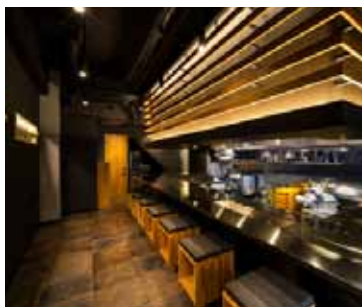
■ 「座銀」カウンター 間接照明に映える組木がモダンな印象に