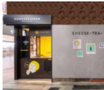
■ 「この世界観」カウンター インスタ用の撮影背景となる壁も用意