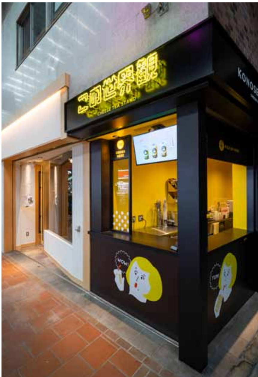
■ エントランス 隣り合わせになった2つのブランドを黒と白とコントラストの高いカラーで融合させたエントランス