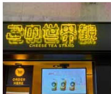
■ 「この世界観」元町商店街側サイン 思わず撮影したくなるネオン管のサイン