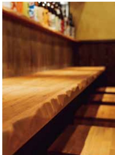
角を取るなど細部にまで素朴な雰囲気に

奥の個室は着脱式のパーティションにより、仕切り位置を変えて様々な状況に柔軟に対応できる