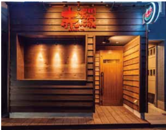
■ エントランス エントランス横のアルコーブには季節ごとのお知らせが掲示できる