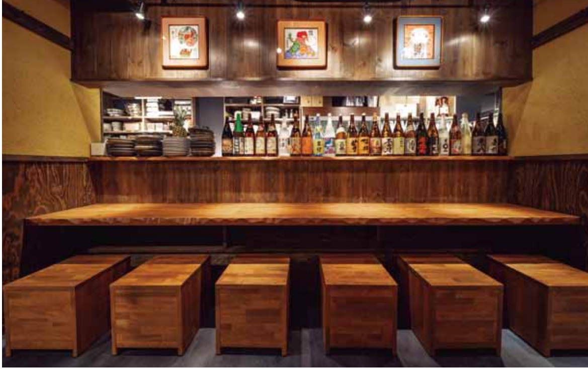
■ カウンター カウンターの立ち上がりには自慢の酒が色とりどりにディスプレイされて、華やかな雰囲気を演出