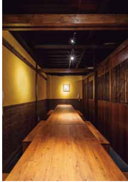
■ 個室 壁を取り払うと20名近く収納可能な大きな個室に