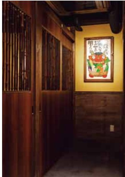
■ 廊下 廊下の突き当りの壁には赤おにの素朴な絵が飾られる