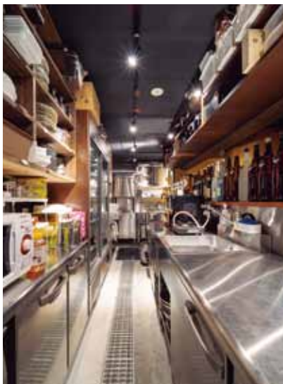
作業台を広くとった使い勝手のいい厨房