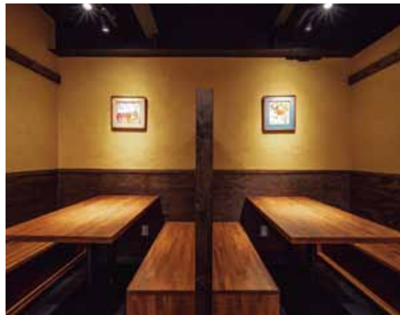
■ ボックス席 4名掛けのボックス席の椅子の下部に収納が設けられている