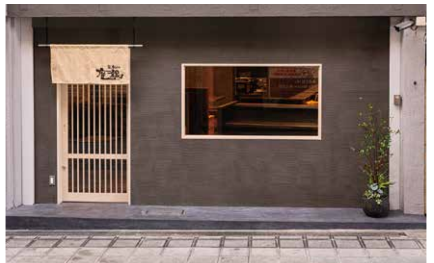
■ 料亭のような上質感のあるエクステリアデザインは座銀ブランドの証