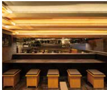
■カウンター席 厨房の活気が伝わるレイアウトが人気の秘密