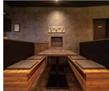
■ボックス席 シートに物入れを仕込みスペース効率を改善