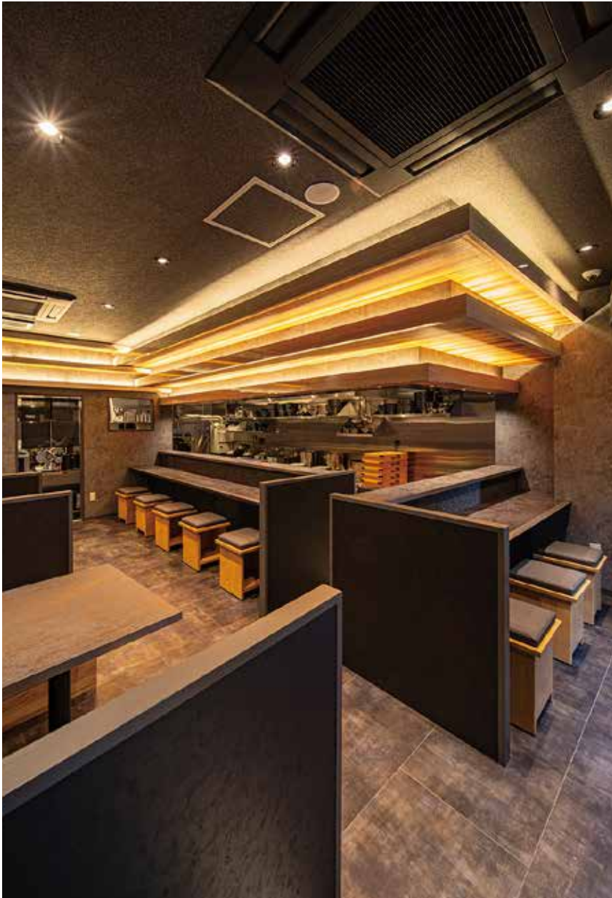
■カウンター席 カウンター上のパースペクティブを強調するディスプレイのインパクトが上質感を演出します