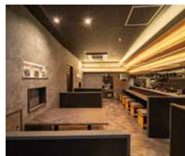
■ 商店街からエントランスの扉をからりと開けると上質感のある空間が広がる