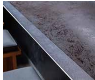
■カウンターディテール エージング加工の素材で上質なイメージに