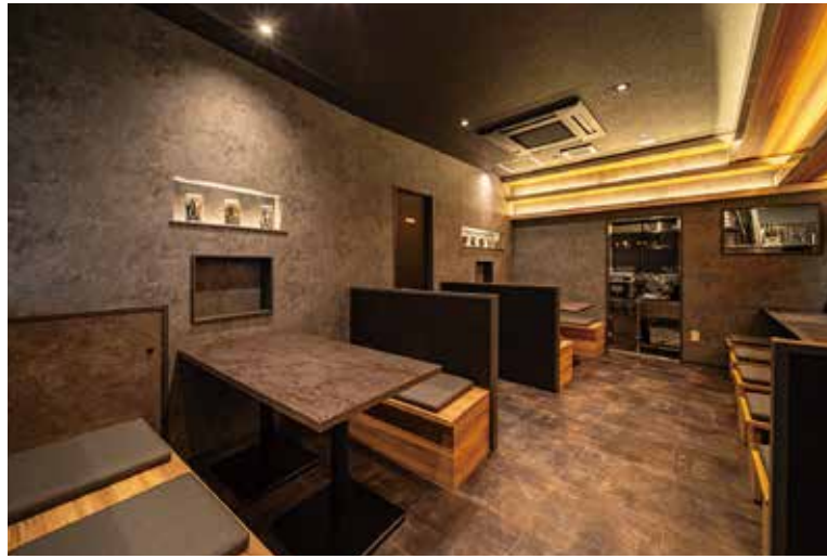
■ホール&カウンター席 フロアは少しザラリとした質感のタイルで仕上げて滑りにくさという機能性と高級感を両立