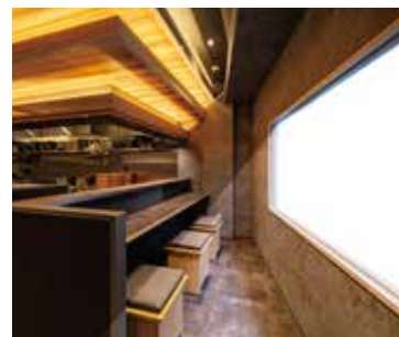
■ 通りに面して開口部の大きな窓を設けて暖かい感を演出