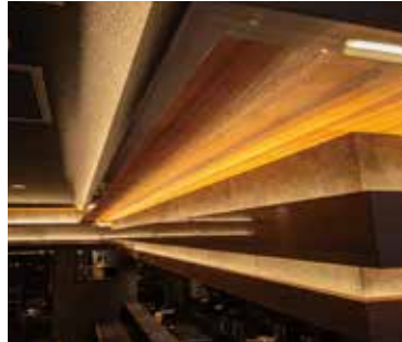
■カウンター上 間接照明で木目が鮮やかに浮かび上がります