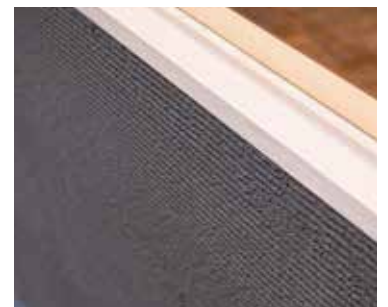
■ コテの仕上げが難しい校倉仕上げで上質感を演出した外壁ディテール